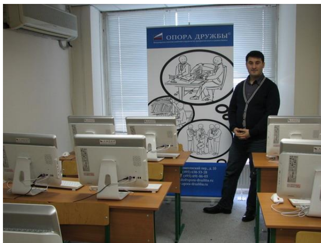
Рисунок 1. Компьютерный зал в «Опоре Дружбы». Здесь проходят компьютерные курсы для мигрантов, а по выходным мигранты могут бесплатно общаться с родными по скайпу.